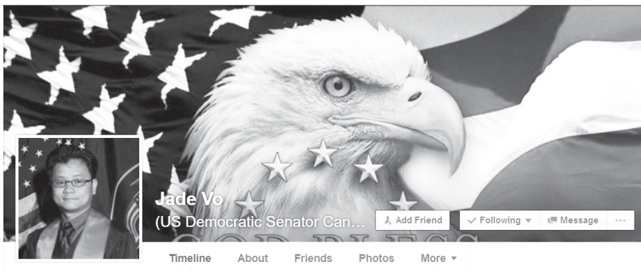
Hình cover trên trang facebook của ông Võ Quốc Tuấn, ứng cử viên Thượng Nghị Sĩ tiểu bang Utah năm 2016. ( https://www.facebook.com/jadeforsenator )